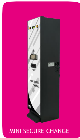
MINI SECURE CHANGE